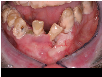
Makroskopie - Bild 1