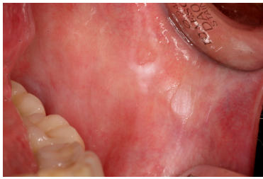
Makroskopie - enoral