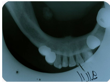
Bildgebung - Aufbissaufnahme präoperativ