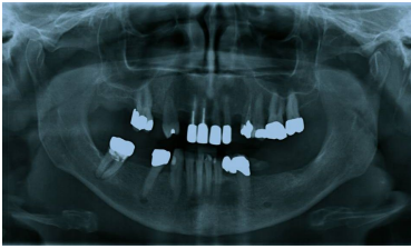
Bildgebung - OPAN präoperativ