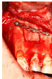
Makroskopie - intraoperativ