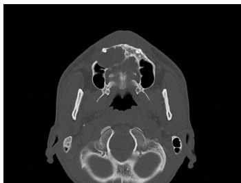
Bildgebung - CT axial präoperativ