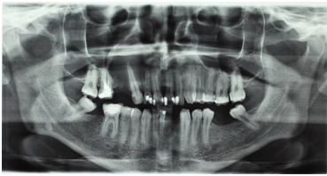
Bildgebung - OPAN präoperativ