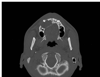
Bildgebung - CT axial präoperativ