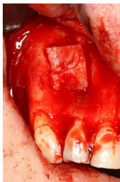
Makroskopie - intraoperativ