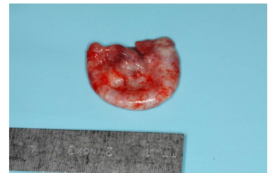
Makroskopie - intraoperativ