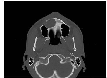
Bildgebung - CT axial präoperativ